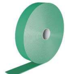
NAIL PLASTER Seite 134