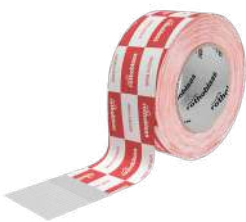
SPEEDY BAND Seite 76