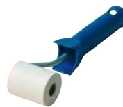
ROLLER Seite 393