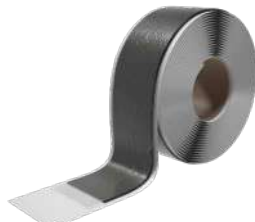
BLACK BAND Seite 144